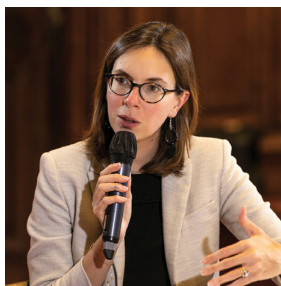
AMÉLIE DE MONTCHALIN Ministre de la Transformation et de la Fonction publiques

Chaque semaine, les trois directions sont réunies au sein d'un comité dirigé par la Ministre.