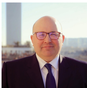
THIERRY LAMBERT Délégué interministériel de la Transformation publique (DITP)