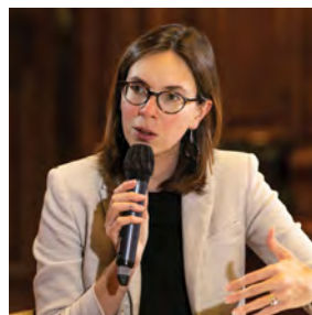
AMÉLIE DE MONTCHALIN Ministre de la Transformation et de la Fonction publiques

Chaque semaine, les trois directions sont réunies au sein d'un comité dirigé par la Ministre.