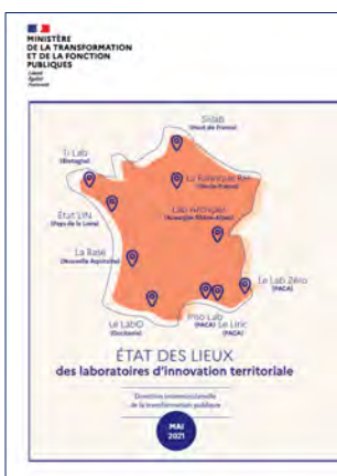
LE LIVRET DES LABS 2021